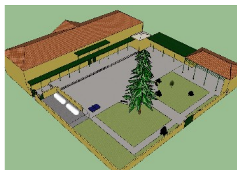
Illustration 1: Modélisation Sketchup - Alexis